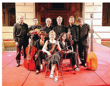
ITALIANI L'ensemble «La venexiana»

Un festival dedicato alla musica che si eseguiva, fra Cinquecento e Seicento, in un palazzo nobiliare, qual era anche Villa Medici a Roma, per il diletto della corte e per l'affinamento del gusto dei suoi componenti, non poteva non includere una serata interamente dedicata a musiche del «divino» Claudio Monteverdi (1567-1643), per un periodo al servizio della lussuosa e sofisticata corte di Mantova e per un altro, assai più lungo, dal 1613 fino alla sua morte, del patriziato di Venezia e della basilica marciana. Protagonista indiscusso della musica vocale dell'epoca, le sue massime realizzazioni le ebbe nei campi del madrigale e del nascente melodramma, al punto che il suo nome, associato a quello di Giuseppe Verdi, è stato assunto per indicare inizio e fine della più grande musica vocale italiana. Monteverdi, nel corso della sua lun-