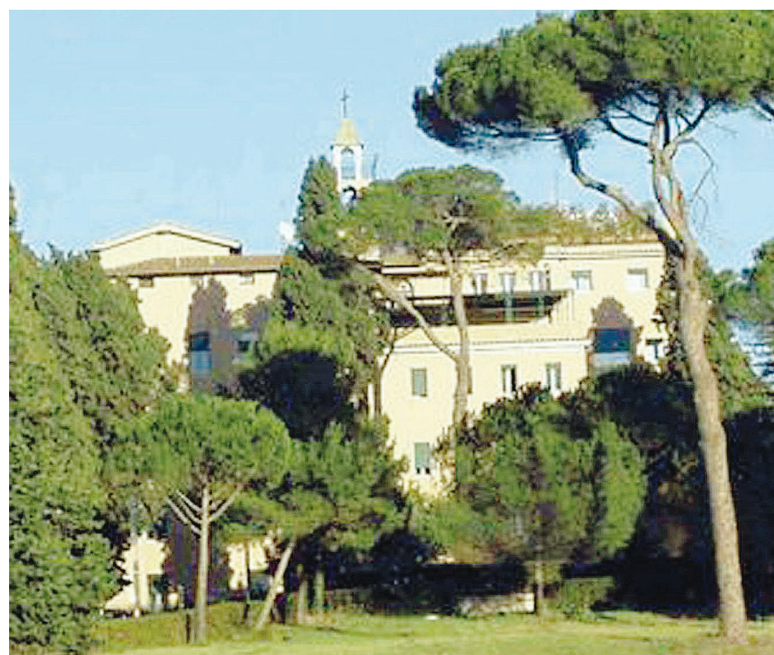
SPIRITISMO Un'immagine di Villa Stuart, la cui storia è davvero singolare

Sogni o follia? Anni dopo però gli operai, che lavoravano per risistemare la villa, buttarono giù un muro nei sotterranei e scoprirono lo scheletro di Lord Allen.